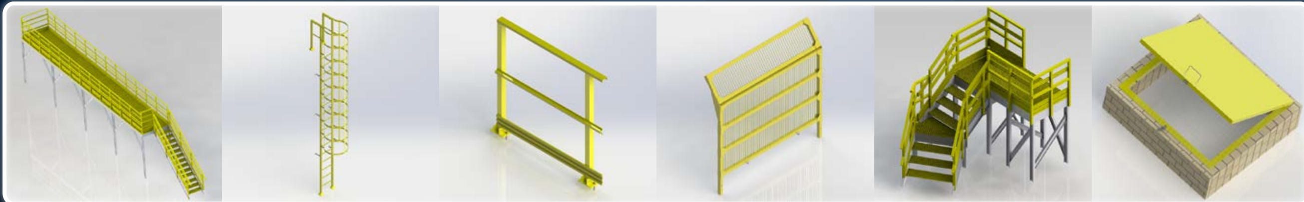
Tampas em Fibra